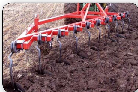
VM 3500 - NOSTOLAITEMALLI